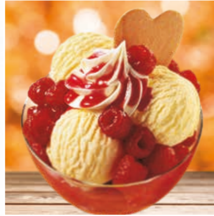
Eis & Heiß mit Himbeeren

Drei Kugeln Bourbon-Vanilleeis mit warmen Himbeeren und Sahne.