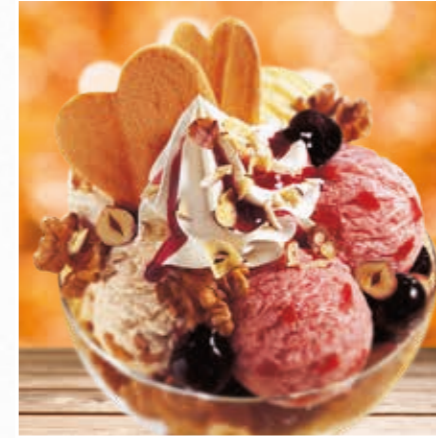
Becher für zwei

Großer Eisbecher zum Teilen mit sieben verschiedenen Sorten Eis und üppig garniert.