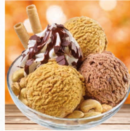
Salted Caramel Cashew Becher

Zwei Kugeln Salted Caramel kombiniert mit einer Kugel Schokolade garniert mit Cashewkernen, Sahne und Schokosauce.